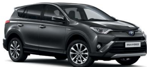
Gris Atlas métallisé* (1G3)