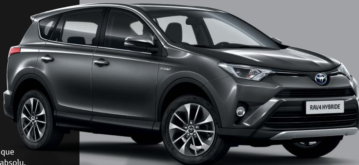
RAV4 Hybride Tendance avec jantes 17" Mojave

Avec le RAV4 Hybride Tendance, découvrez un véhicule doté d'un niveau de confort supplémentaire : l'élégance du tableau de bord gainé de cuir noir, les innovations technologiques pratiques comme le système d'ouverture/fermeture et démarrage sans clé "Smart Entry & Start", les rétroviseurs extérieurs rabattables électriquement, sans compter la climatisation à régulation automatique bizona. Voyagez sereinement dans un confort absolu.