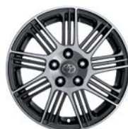
Jante Pitlane 18" alliage anthracite poli