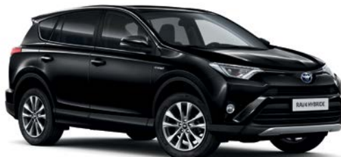
Noir Intense métallisé* (209)