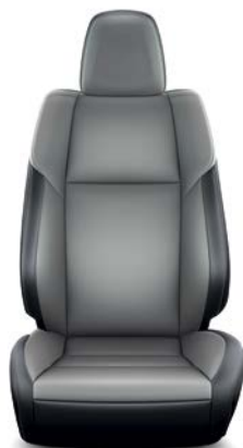
Sellerie cuir gris (1) (Réf. : 10) RAV4 Lounge.