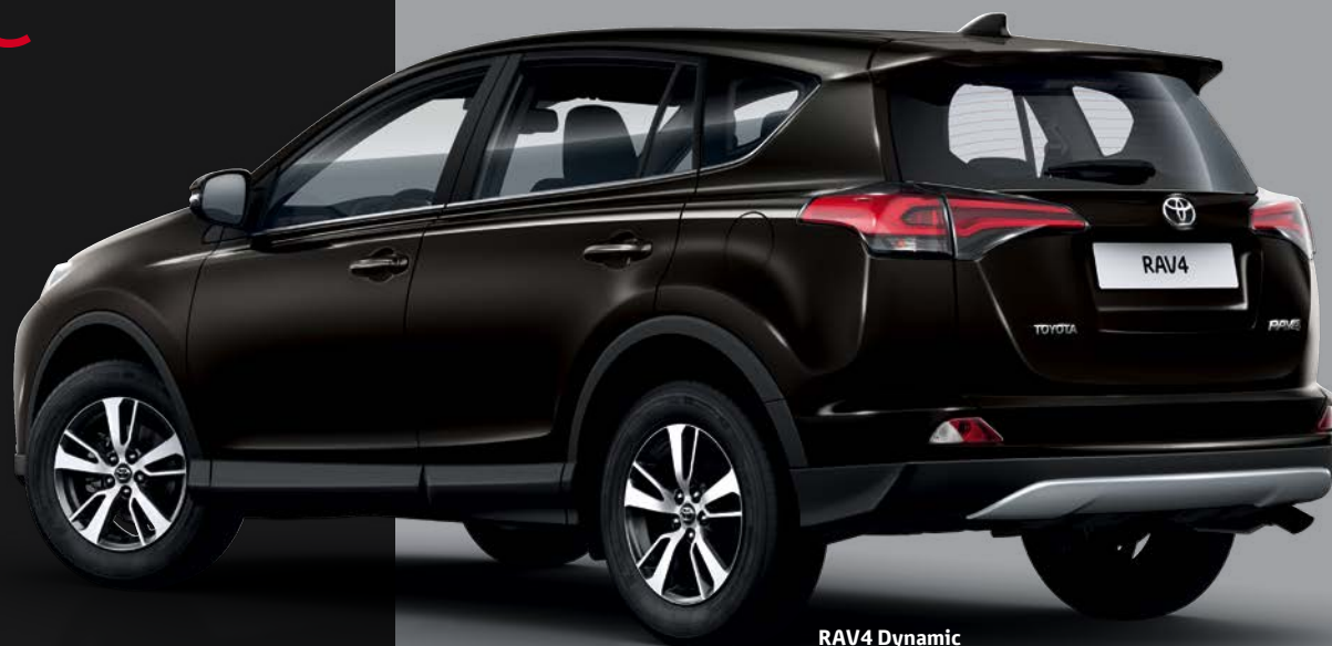
RAV4 Dynamic avec jantes 17" Namus

Le RAV4 Dynamic propose également plusieurs Packs spécifiques qui vous permettront de personnaliser votre véhicule à votre image.