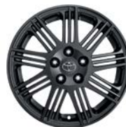
Jante Pitlane 18" alliage anthracite