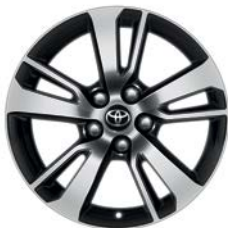
Jante en alliage 17" Namus RAV4 Dynamic Conventionnel.