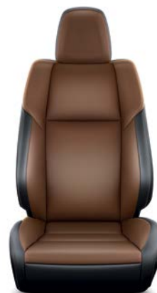
Sellerie cuir havane (1) (Réf. : 30) RAV4 Lounge.