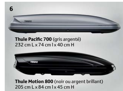
Thule Pacific 700 (gris argenté) 232 cm L x 74 cm l x 40 cm H