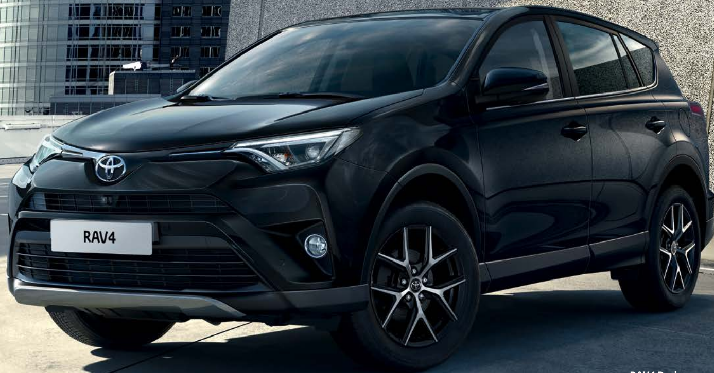
RAV4 Design avec système de vision 360° en option.