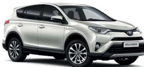
Blanc Nacré* (070)