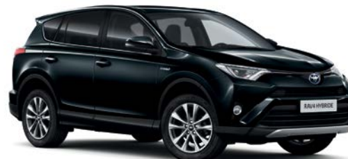
Noir Cobalt métallisé* (221)