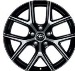
Jante en alliage 18" Tanami RAV4 Design et RAV4 Dynamic - Pack Graphic.