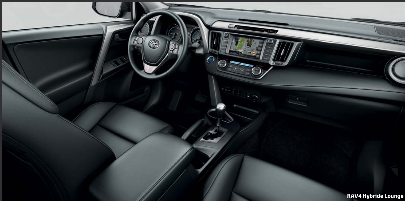
RAV4 Hybride Lounge