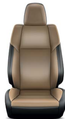
Sellerie cuir beige (1) (Réf. : 40) RAV4 Lounge.