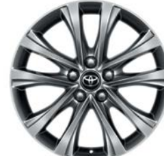
Jante en alliage 18" Sonora RAV4 Lounge.