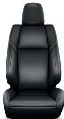
Sellerie cuir noir (1) (Réf. : 20) RAV4 Lounge.