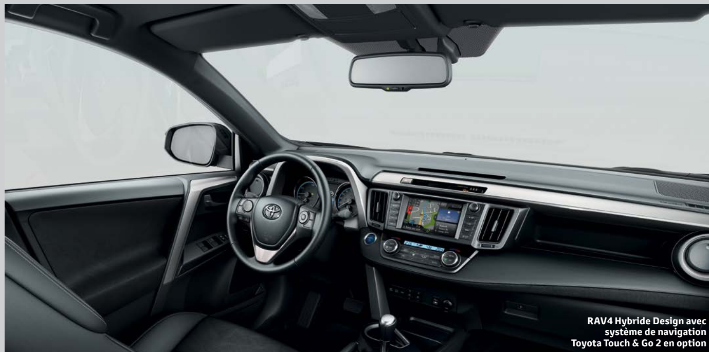
RAV4 Hybride Design avec système de navigation Toyota Touch &amp; Go 2 en option