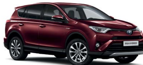
Rouge Pourpre métallisé* (3T0)