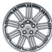
Jante Pitlane 18" alliage argenté