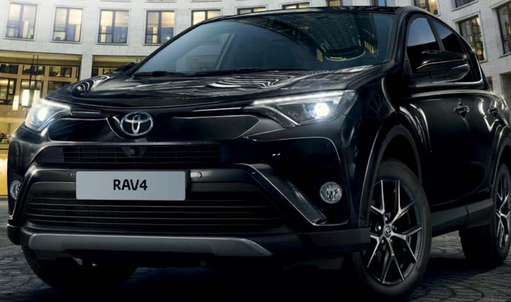
RAV4 Design avec système de vision 360° en option.

Avec le moteur essence 151 VVT-i, en boîte manuelle 6 vitesses ou Multidrive S CVT, profitez des larges possibilités d'un 4 x 4 polyvalent à toute épreuve.