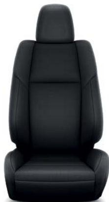
Sellerie tissu Sport RAV4 Dynamic.