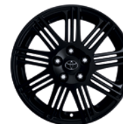
Jante Pitlane 18" alliage noir mat

*Les tailles de jantes et les montes pneumatiques utilisables sont déterminées par l'homologation (se référer à la fiche technique du véhicule). Pour les pneumatiques hiver, une tolérance est appliquée. Pour plus d'informations, veuillez vous rapprocher de votre concessionnaire Toyota.