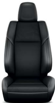
Sellerie tissu, cuir et Alcantara® Design RAV4 Design.