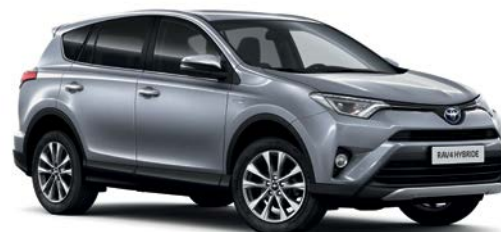
Gris Acier métallisé* (1D6)