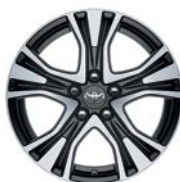
Jante Poseïdon 17" alliage anthracite poli