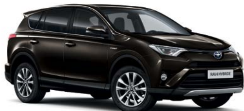
Brun Havane métallisé* (4U5)