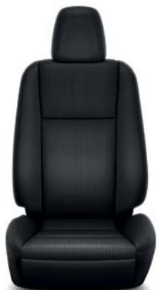
Sellerie tissu noir RAV4 Active.

(1) Sellerie cuir : La partie centrale de l'assise, les faces avant du dossier et de l'appui-tête, ainsi que les faces intérieures des renforts latéraux des sièges et de la banquette arrière sont revêtues de cuir. Les parties latérales, arrière et inférieures des sièges et de la banquette arrière ainsi que les panneaux de portes sont en simili-cuir.